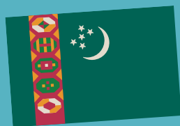
In Turkmenistan mag man Teppiche gern.