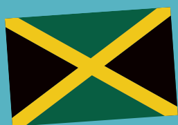
Jamaika verzichtet auf Rot, Blau und Weiß.