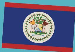
Belize hat Menschen auf der Flagge.

Es gibt viele Theorien dafür, wie Flaggen erfunden wurden. Eine lautet, dass ein chinesischer Kaiser vor rund 3000 Jahren immer einen weißen Fetzen vor sich hertragen ließ. Etwa zur selben Zeit haben sich die Herrscher im heutigen Indien Tiger und Elefanten auf ein Stück Stoff gemalt. Sie wollten damit Stärke ausdrücken und ihren Gegnern Angst machen. Andere glauben, die alten Ägypter oder Römer waren noch früher dran. Im Grunde ging es den mächtigen Herrschern aber einfach nur darum, erkannt zu werden. Sie wollten, dass ihre Soldaten sofort wissen, für wen sie kämpfen müssen, und die Gegner sollten gleich kapieren, mit wem sie es zu tun haben. Das war auch so, als vor rund 250 Jahren die ersten Nationalstaaten entstanden. Man verordnete den Menschen in einem Land eine gemeinsame Sprache, eine Hymne zum Singen und eine Flagge. Das weckt Emotionen bei Menschen. Sie sollten so leichter dazu bereit sein, ihr Land zu lieben und dafür zu kämpfen.