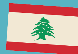
Libanon sieht aus wie Österreich mit Baum.