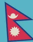
Nur Nepal hat keine viereckige Flagge.